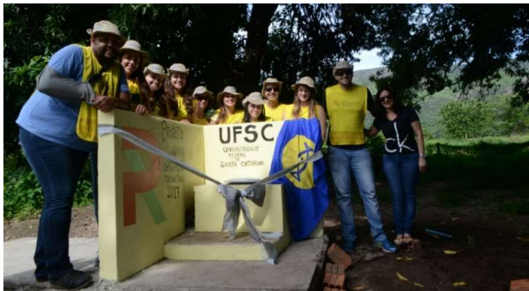
Figura. 3. Rondonistas da UFSC na entrega do Banheiro Seco no Colégio Agrícola no município de Natividade, estado do Tocantins

considerações da difusão desta tecnologia com uso de matérias primas de baixo custo, disponíveis na região. Esta atividade, além de receber grande repercussão dos meios de comunicação locais durante a sua realização, foi premiada no III Congresso Nacional do Projeto Rondon (III CONGRESSO NACIONAL DO PROJETO RONDON, 2024), realizado em Brasília-DF em 2017. (Figura 3)